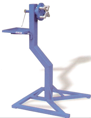
ΒΑΣΗ ΜΗΧΑΝΩΝ 111