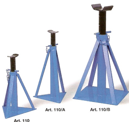
ΣΤΡΙΠΟΔΟ ΑΥΤΟΚΙΝΗΤΩΝ 110