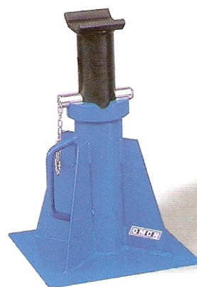
ΣΤΡΙΠΟΔΟ ΦΟΡΤΗΓΩΝ 15TN. 217